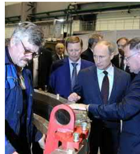
Президент России В. Путин на Обуховском заводе (июнь 2013 года).